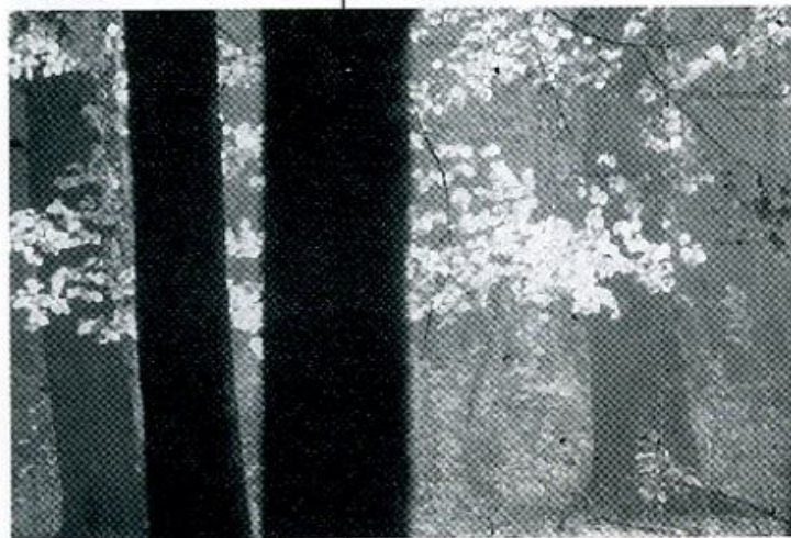
De majestueuze bomen