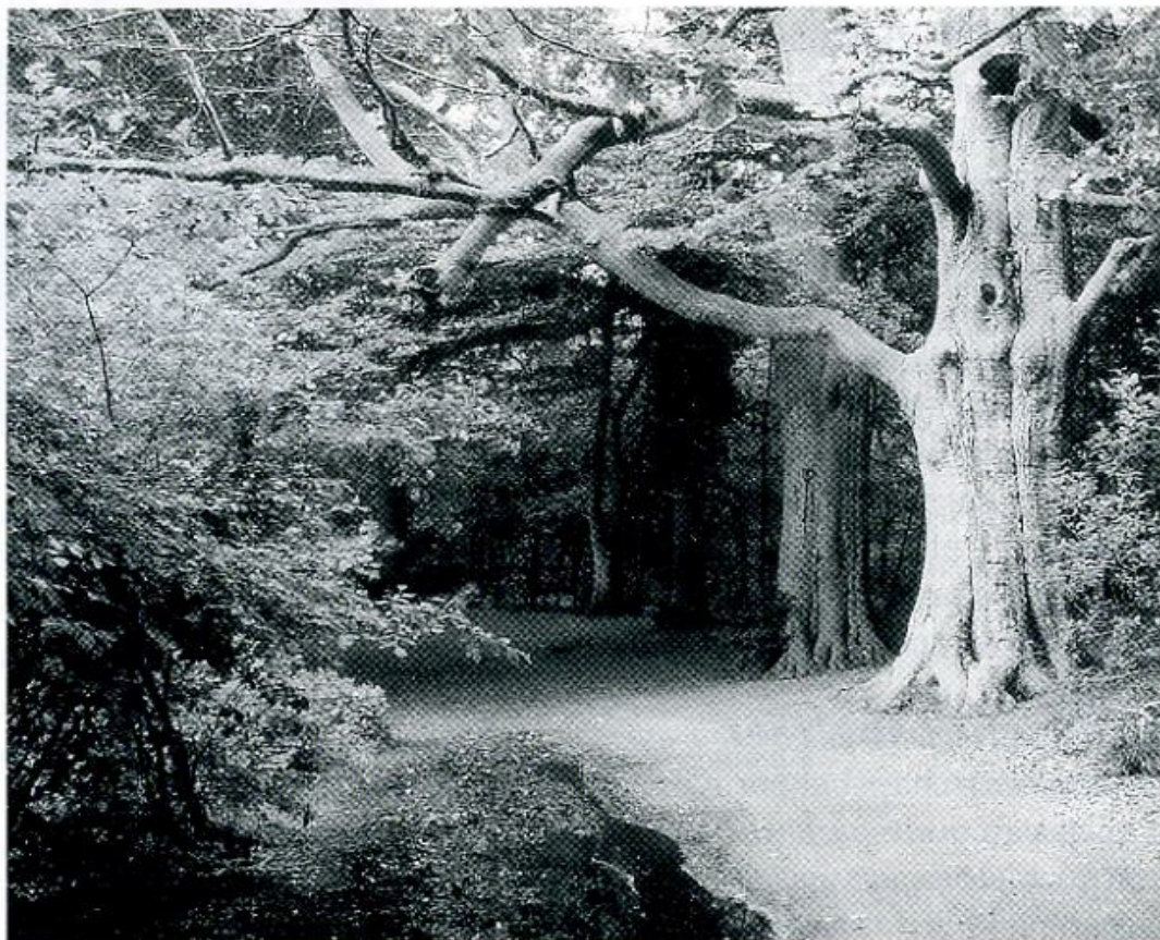
Rust op De Vuursche