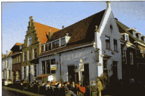
Het oude centrum van Naarden.