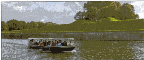
Vaartocht langs de vesting.