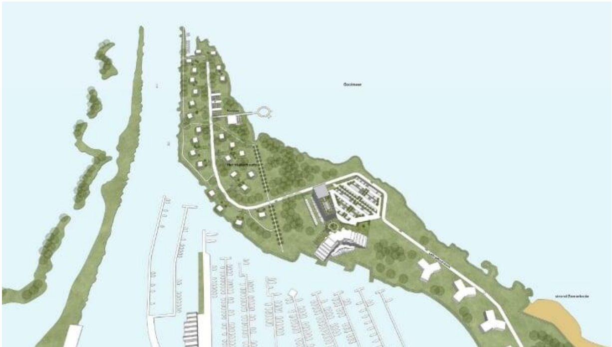
Een impressie van hotel en park met vakantiewoningen op de landtong.

De SVE Group stelt in het plan optimistisch te zijn over de haalbaarheid van het project op basis van het ontwerp en de beschreven uitgangspunten. Na akkoord op hoofdlijnen van de gemeente is het bedrijf bereid om te investeren in een planuitwerking en nadere afstemming met de gemeente over het vervolg van het proces. Ze hoopt zelfs op een hoogwaardige en spoedige invulling van de 'prachtige plek' in Huizen.