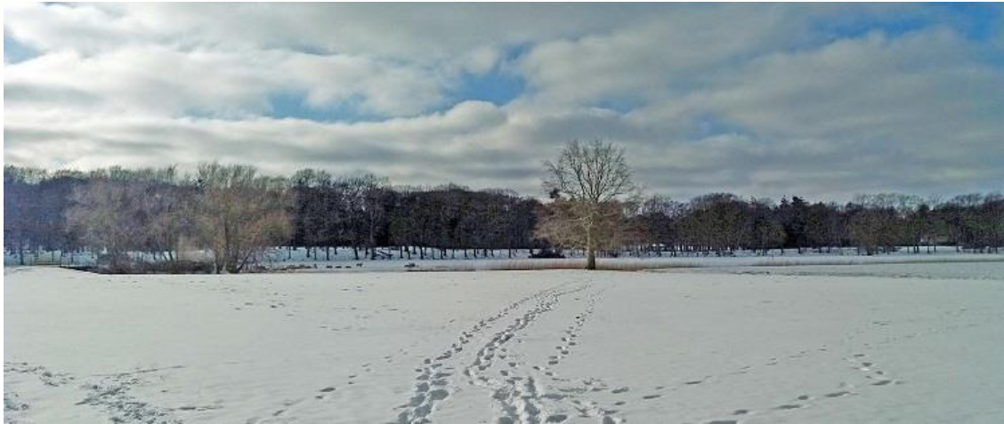
Zanderij bij Oud Naarden, februari 2021